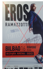
Markaren erabilera okerra