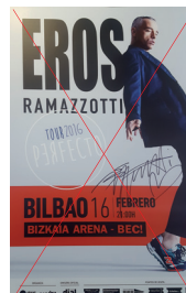
Uso incorrecto de la marca