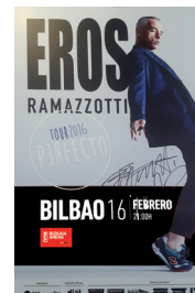
Uso correcto de la marca